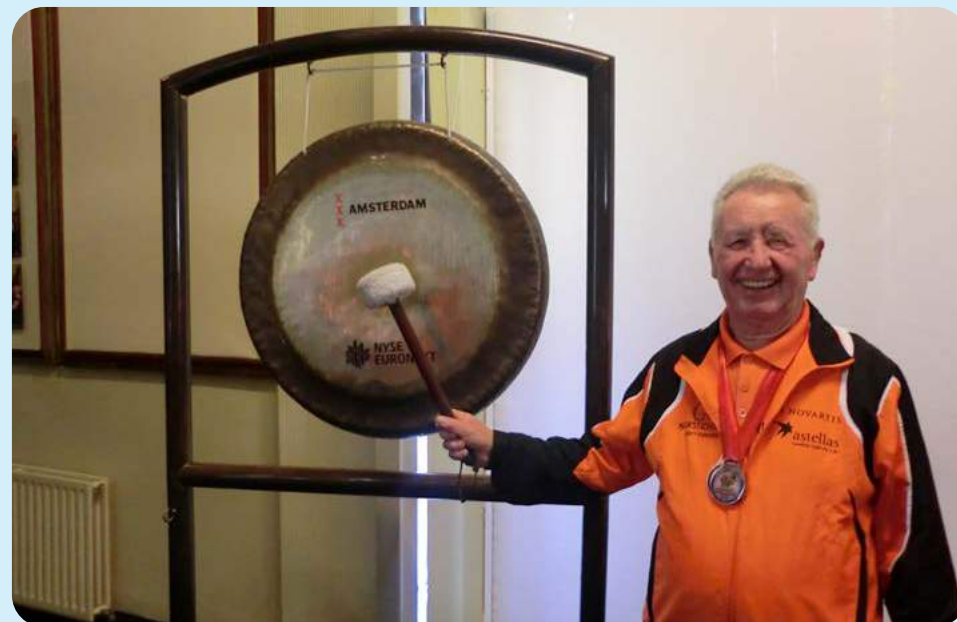
Opening Beurs Amsterdam in 2013

Alles overziend kan worden geconstateerd dat deze man zeker na zijn transplantatie de draad goed heeft opgepakt, alles uit het leven heeft gehaald en sportief uitstekend heeft gepresteerd. Niet voor niets kopte de plaatselijke Scherpenzeelse Krant bij zijn overlijden: Piet Osnabrugge (1939-2022), 'een markante persoonlijkheid'.